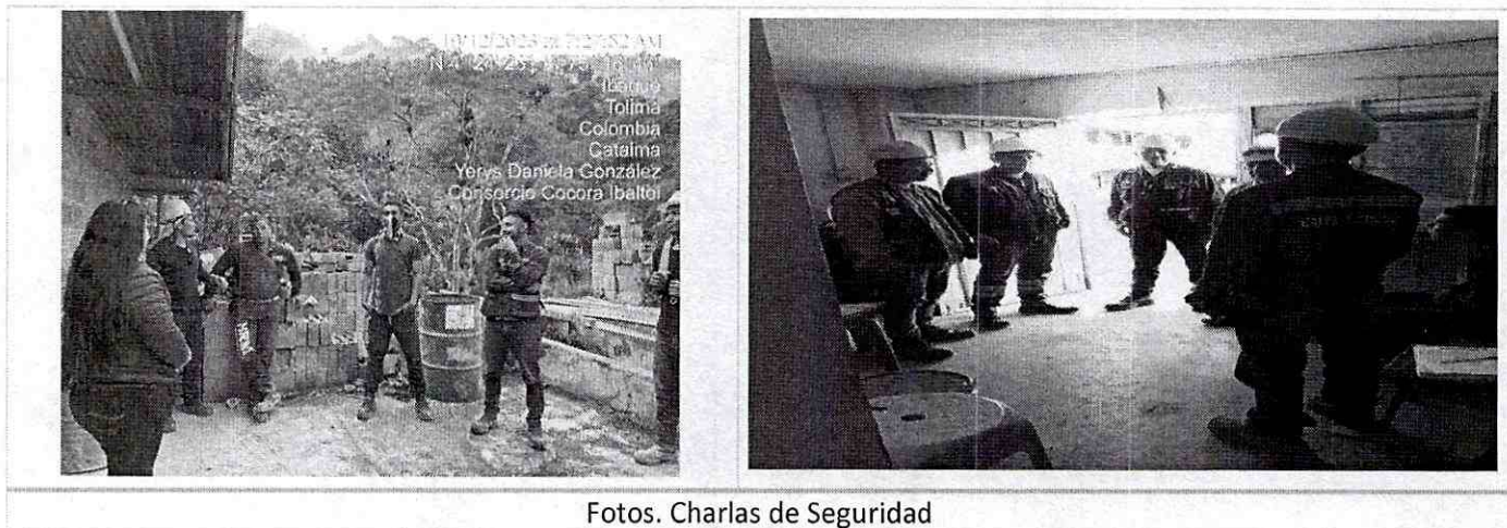
Fotos. Charlas de Seguridad