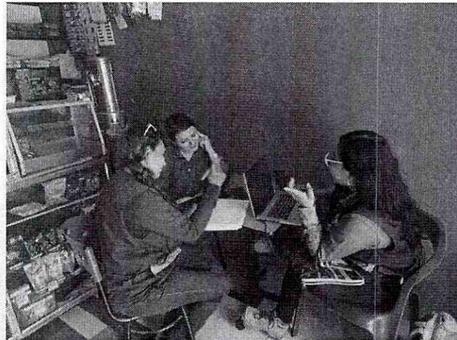
Foto. REUNION COPASST

A continuación, se presentan las actividades ejecutadas en el área de Seguridad y Salud en el Trabajo durante el periodo comprendido entre el 20 noviembre al 16 de diciembre de 2023