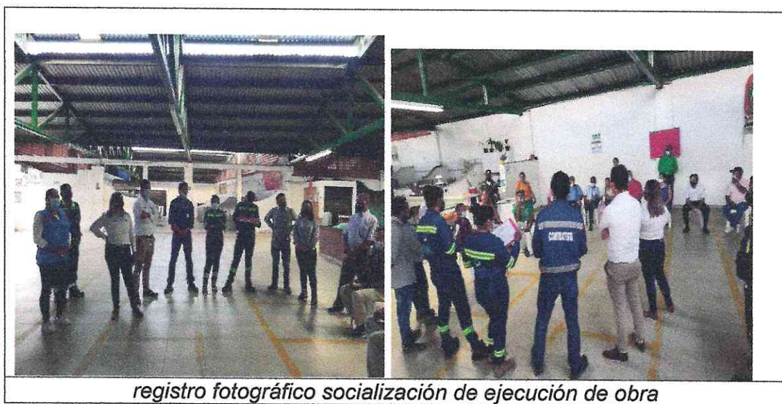
registro fotográfico socialización de ejecución de obra

El día 25 de octubre en las instalaciones de la plaza de mercado del barrio el saludo se llevó a cabo socialización con la comunidad se este sector para dar a conocer el alcance del proyecto y cada una de las actividades que se ejecutaran, esta socialización fue precedida por funcionarios del Ibal, interventoría y contratista.