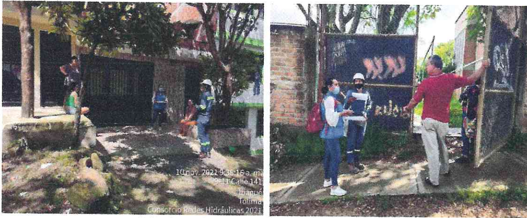
1.Registro fotográfico socialización inicio de obra

El día 10 de noviembre del presente año en el sector del barrio Ceiba Norte de la calle 141 se realizó socialización con la comunidad para dar a conocer cada una de las actividades que se van a ejecutar en obra, al igual se les socializo el trabajo social que se implementara antes de iniciar la parte constructiva con el levantamiento de la ficha técnica del levantamiento de las actas de vecindad y la colaboración con la comunidad para el suministro de agua y energía. Se les informa que antes de iniciar la obra se avisará para las personas que tienen vehículos los guarden en otro lugar.