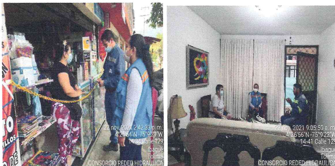
3. Registro Fotográfico de socialización de suspensión del servicio del agua

El 22 de noviembre del presente año se realizó visita a los predios del sector Montecarlo en la calle 129 con la finalidad de socializarles que en el transcurso del día se suspendería el servicio del agua por actividades de obra como lo es el empalme para lograr habilitar la calle.