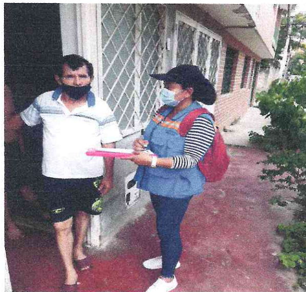
Registro fotográfico trabajo social

La profesional social de las redes hidráulicas elaboro un certificado para que los líderes y vecinos de los sectores de Praderas de Norte, La Cabaña y Cantabria certificaran que el Consorcio Redes Hidráulicas realizaron actividades de obras como: alcantarillado, acueductos y acometidas con sus respectivas cajas de inspección.