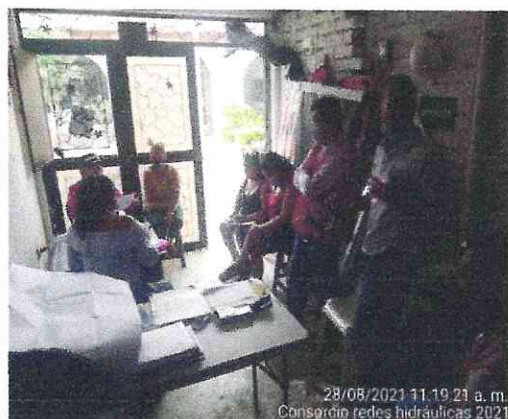
Registro fotográfico del comité de Veeduría

Este comité tiene como objetivo dar a conocer el avance de la obra y las inquietudes que tienen sobre el desarrollo del proyecto. Este comité tuvo el acompañamiento del supervisor del Ibal, interventoria, y contratistas para dar respuestas a cada una de las dudas e inquietudes.