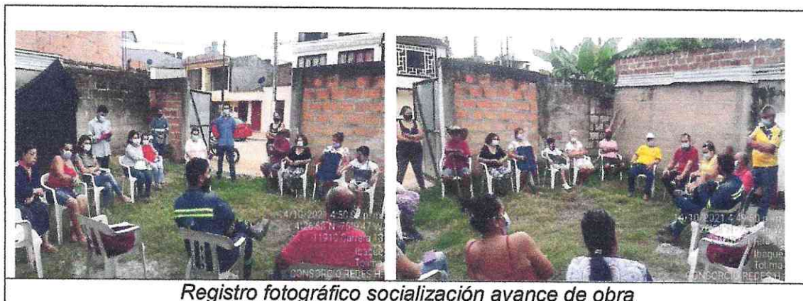
Registro fotográfico socialización avance de obra

El día 14 de octubre se realizó socialización de avance obra con la comunidad de los sectores La Cabaña y Cantabria para da a conocer el desarrollo de la obra y de igual manera escuchar las sugerencia e inquietudes de la comunidad, en la socialización se conto con los ingenieros residentes de contratista, interventoría y comunidad en general.