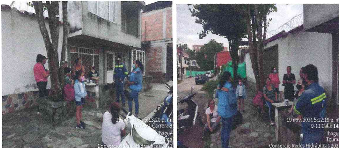
2. Registró fotográfico de socialización inicio de obra