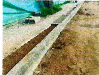
Fundida de andenes