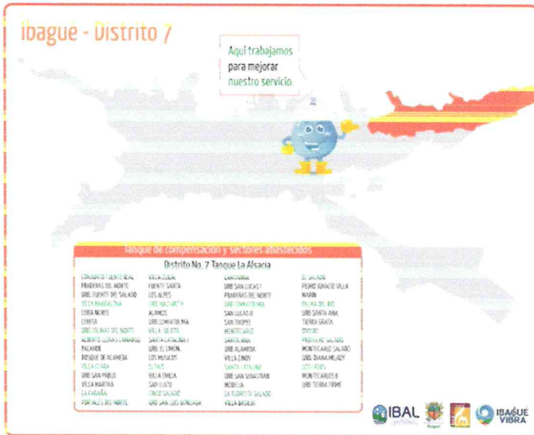
Ilustración 1 Ubicación General del Proyecto.