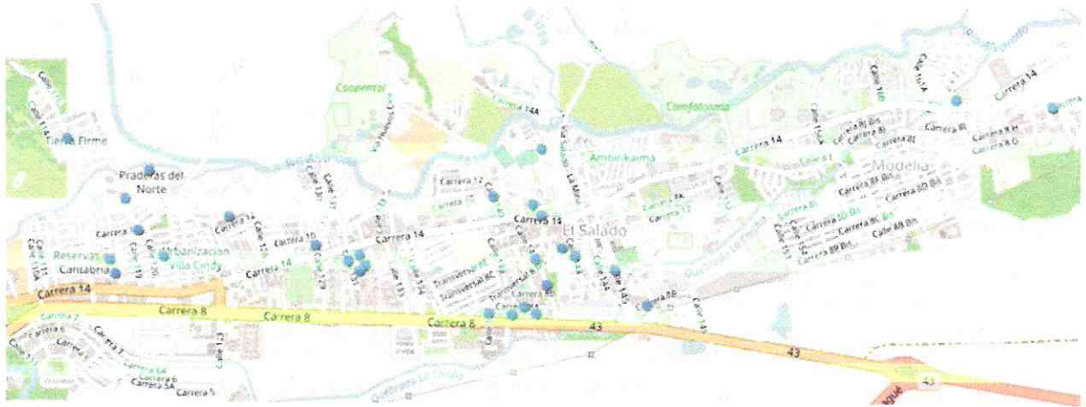
Tabla 3 Inventario Tramos A Intervenir.

A continuación, se ilustra la ubicación de los tramos en la vía a desarrollar en el proyecto en mención.