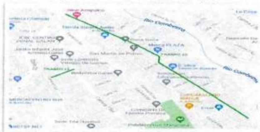
Figura 7. Localización tramo 11 y 12