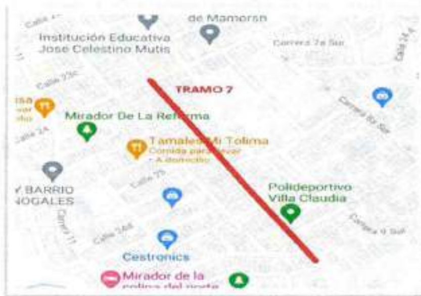
Figura 5. Localización tramo 7