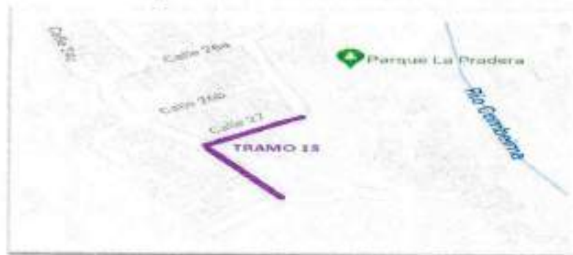
Figura 8. Localización tramo 13