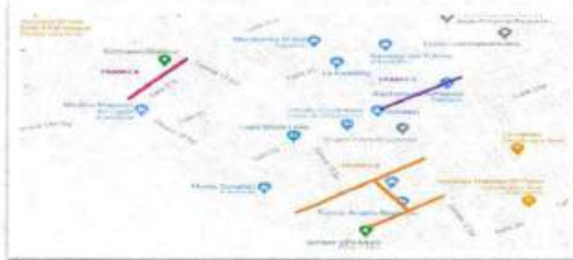
Figura 3. Localización tramo 5 y 8