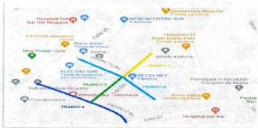
Figura 2. Localización tramo 1, 2, 3 y 4