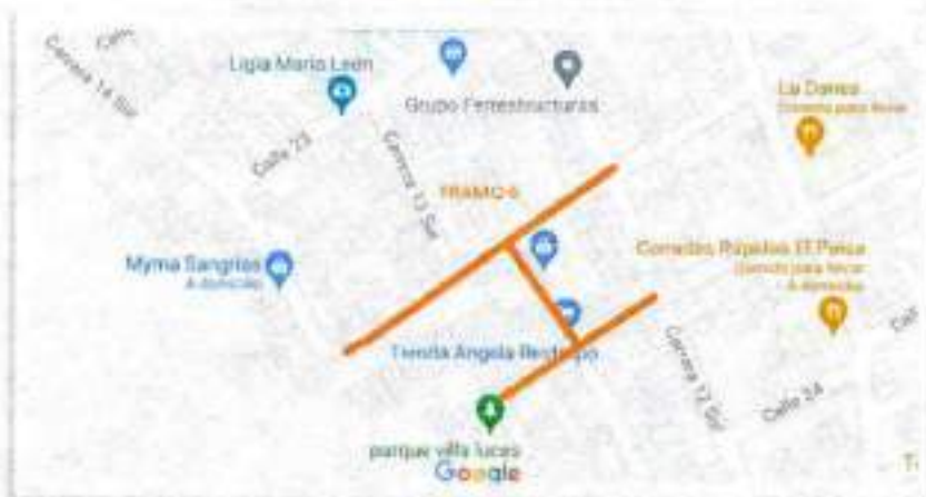
Figura 4. Localización tramo 6