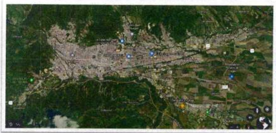
Figura 1. Localización del municipio de Ibagué

Ibagué tiene un clima tropical y tiene una cantidad significativa de lluvia durante el año. La temperatura es en promedio 21.1 ° C. Precipitaciones promedio 1976 mm.