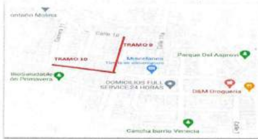
Figura 6. Localización tramo 9 y 10