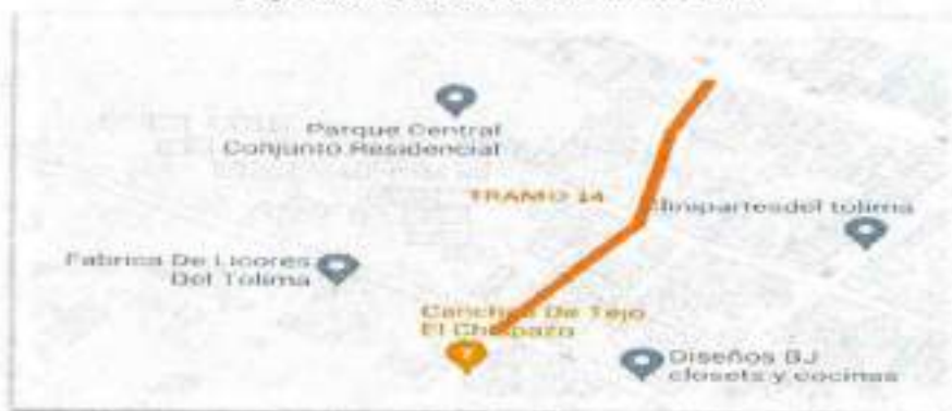
Figura 9. Localización tramo 14.